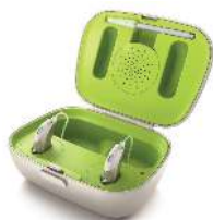
Phonak Charger Case

*תוצאות צפויות לאחר טעינה מלאה ועד ל-80 דקות הזרמת מידע אלחוטית.