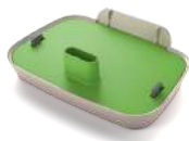
Phonak Power Pack