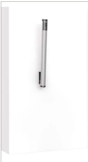
מתקן להתקנה על קיר